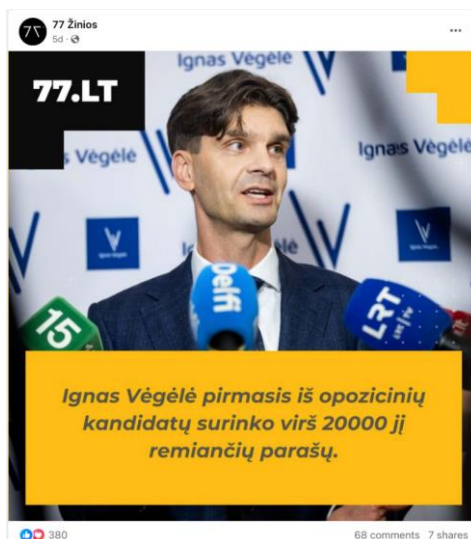
77.lt pranešimas „Facebook“ tinkle apie I. Vėgėlės kandidatūros į Lietuvos prezidentus patvirtinimą.