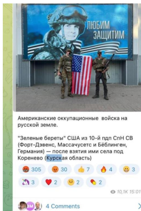
Įrašas „Telegram“ kanale „Amerikos okupacinės pajėgos stovi Rusijos žemėje“.

Visuose pranešimuose apie Ukrainos įsiveržimą į Kursko sritį Vakarai buvo pristatyti kaip itin pavojingi, dažnai vadinami okupantais. Pavyzdžiui, įrašė, kuris sulaukė itin didelio susidomėjimo tarp kanalo sekėjų, buvo įkelta nuotrauka su amerikiečiais, stovinčiais su savo vėliava. Įrašo antraštė skelbė: „Amerikos okupacinės pajėgos stovi Rusijos žemėje“. Absoliuti dauguma sekėjų reakcijų buvo neigiamos, daugiausiai iš jų išreiškta „besikeikiančiu veidu“.