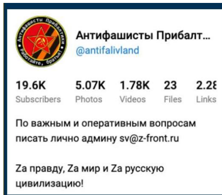
„Telegram“ grupė „Baltijos šalių antifašistai“

Visuose pranešimuose apie Ukrainos įsiveržimą į Kursko sritį Vakarai buvo pristatyti kaip itin pavojingi, dažnai vadinami okupantais. Pavyzdžiui, įrašė, kuris sulaukė itin didelio susidomėjimo tarp kanalo sekėjų, buvo įkelta nuotrauka su amerikiečiais, stovinčiais su savo vėliava. Įrašo antraštė skelbė: „Amerikos okupacinės pajėgos stovi Rusijos žemėje“. Absoliuti dauguma sekėjų reakcijų buvo neigiamos, daugiausiai iš jų išreiškta „besikeikiančiu veidu“.